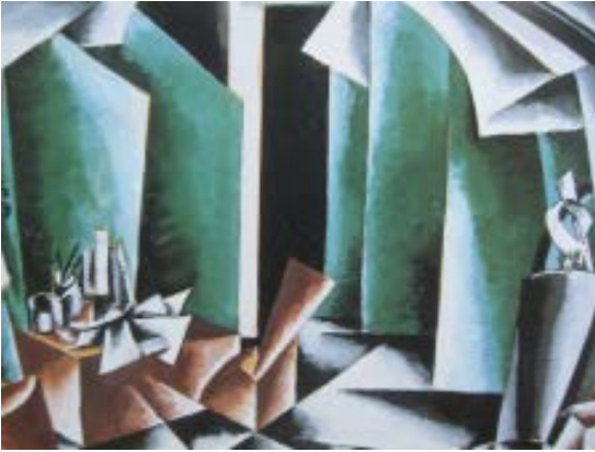
Theater Bühnenbild von Popova