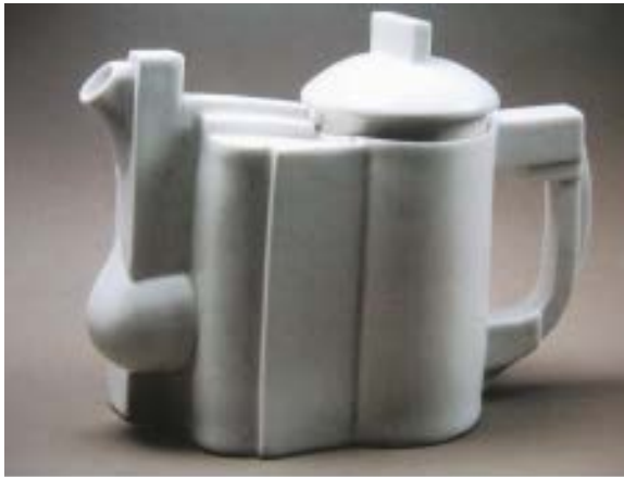
Kanne von Malevitch