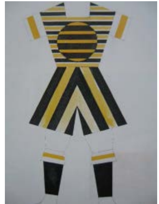
Entwurf von Stepanowa