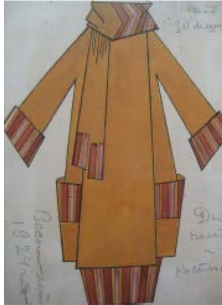
Entwurf von Popova